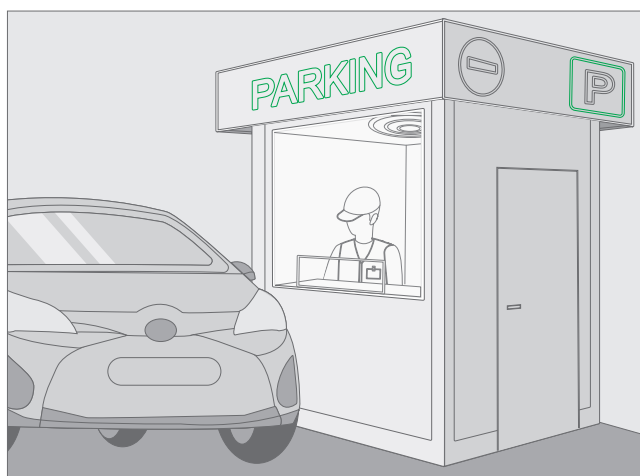
Figura 1 - Cabina de vigilancia en garaje

Esta solución se podrá emplear para proteger pequeños locales habitables situados en grandes áreas que no estén protegidas como, por ejemplo, cabinas de vigilancia en garajes (Figura 1).